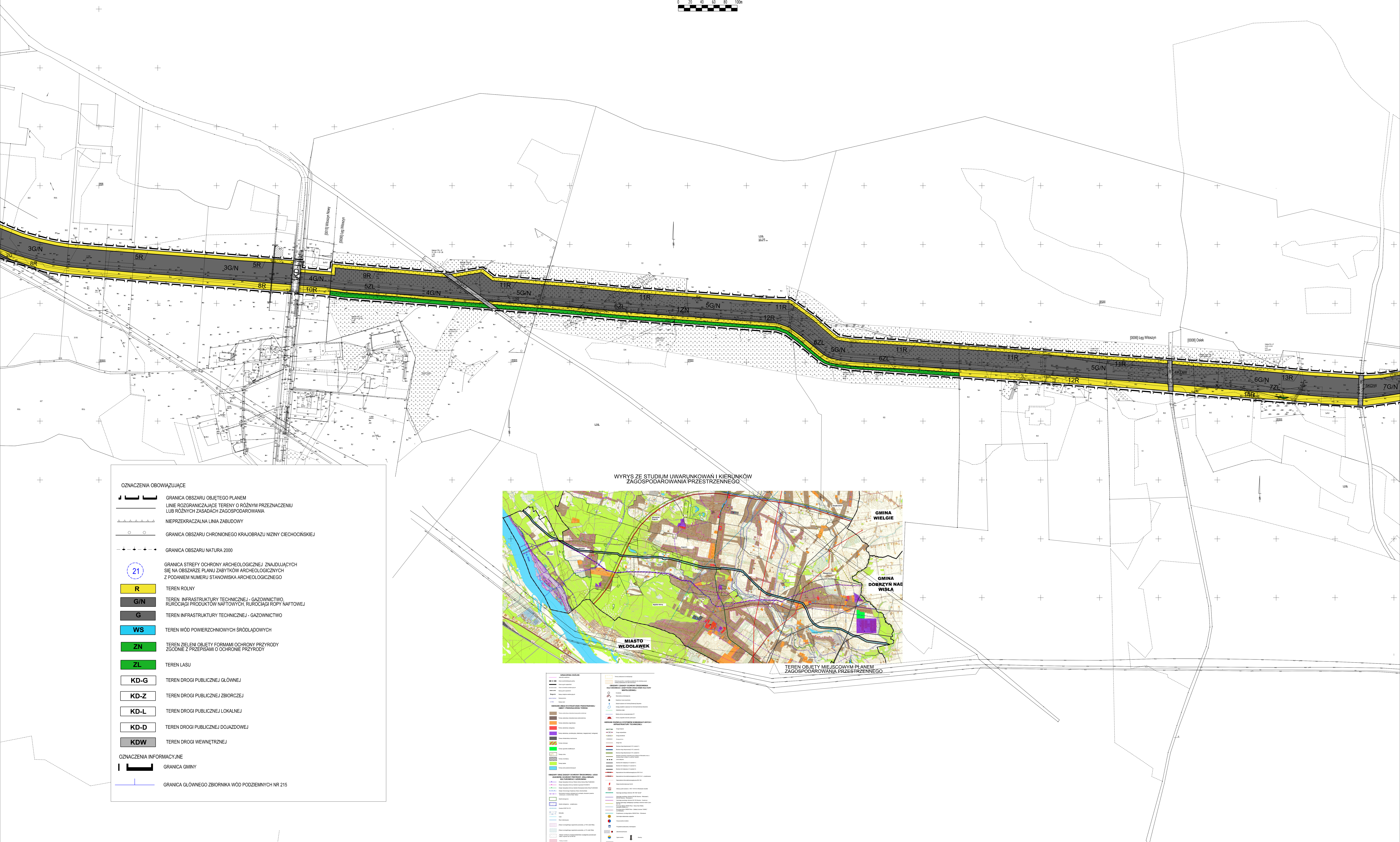
WYRYS ZE STUDIUM UWARUNKOWAN I KIERUNKÓW ZAGOSPODAROWANIA PRZESTRZENNEGO