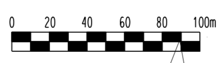
WYRYS ZE STUDIUM UWARUNKOWAŃ I KIERUNKÓW ZAGOSPODAROWANIA PRZESTRZENNEGO